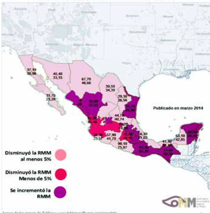
Disminución de la RMM de 2011 a 2012.